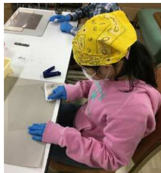
障害者就労施設等でのフェイスシールド加工作業