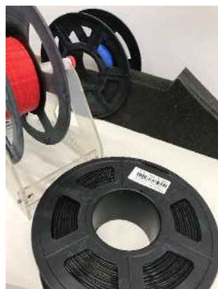
フェイスシールド材料のフィラメント（樹脂）